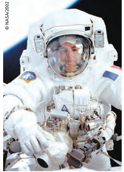
Ces 3 sorties ont constitué les efforts les plus intenses de toute sa vie.

Alors que penser du "tourisme" spatial ? Actuellement, il concerne les vols suborbitaux qui vont permettre à un nombre non négligeable de personnes, quand même fortunées, de voir la terre à 100 kilomètres d'altitude et de prendre conscience dans ses tripes de sa fragilité. Ceci est différent du vol 0G (ou gravité 0) tel qu'il sera accessible par tous et qui permettra de "sentir"