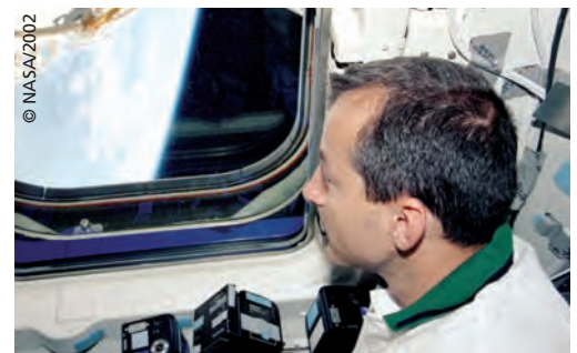
La terre est une "poussière" de vie, entourée d'un fin liseré bleu, au sein d'un noir intense.

une heure de vol en apesanteur et dure rarement plus de 24 heures, sans réelle accoutumance, théoriquement. Pour le prévenir et/ou détecter les sujets les plus sensibles, les Russes, qui ont une approche médicale très stricte, font passer l'épreuve dite "du tabouret". Elle consiste à faire tourner le candidat, yeux fermés et tête inclinée, à 33 tours par minute. Il faut tenir 10 minutes pour être éligible, sachant qu'un quidam moyen ne tient pas 5 minutes sans vomir ! A l'opposé, un cosmonaute français restait imperturbable après 30 minutes dans cette centrifugeuse. Les Américains,